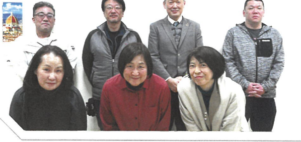
子ども応援部会のみなさん