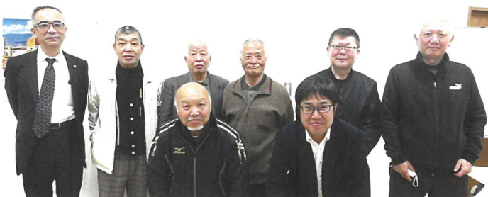
安全安心部会のみなさん